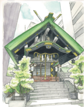
「飯田橋 九段まちかど百景」より @ちよだマーチング委員会